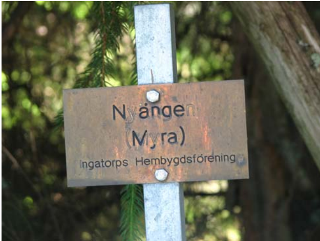
Nyängen Dödringshult Ingatorp sn