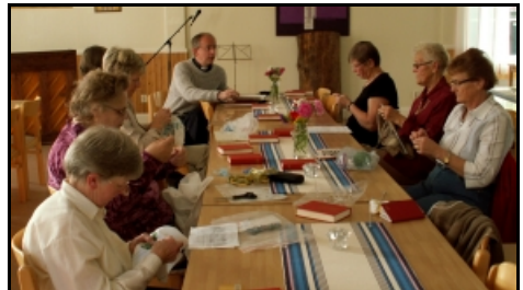
Vid symötet den 3 november underhöll komministern de handarbetande damerna